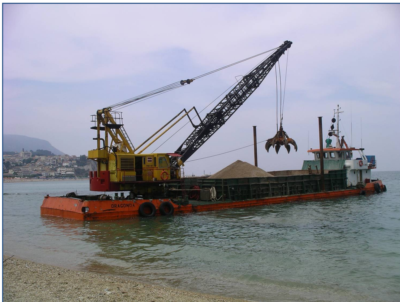
M/N PONTONE “DRAGONDA”

DRAGAGGI RIPASCIMENTI SPIAGGE RIQUALIFICAZIONI AMBIENTALI RIPRISTINO MORFOLOGIE LAGUNARI RECUPERI MARITTIMI COSTRUZIONI MARITTIME